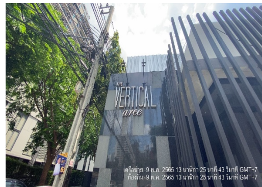
รูปที่ 1.6-1 สภาพภายในพื้นที่โครงการ ณ วันที่ 09 เดือนพฤษภาคม 2565